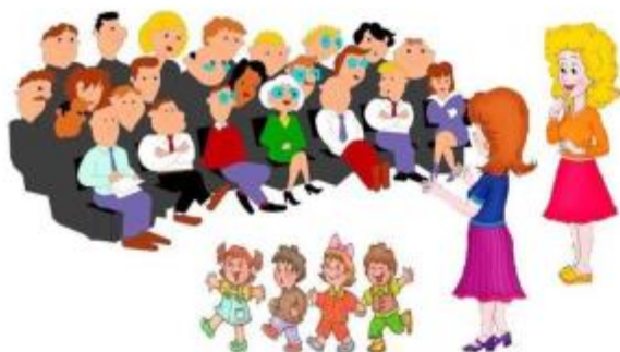
Дети групп Родители групп д/с № 7 с. Майкопское